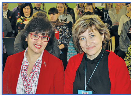
Директор года - 2015