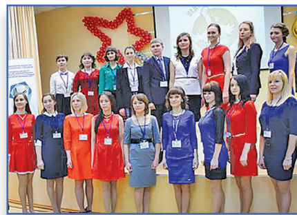
Шаги в профессию