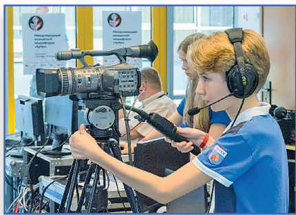
Визитная карточка лицея № 33